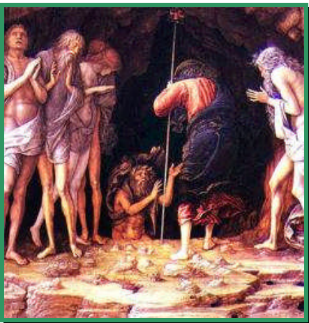
"Descenso al Limbo", de Andrea Mantegna, (1430-1506).

"El temido limbo, localizado entre el cielo y el infierno según una tradición católica surgida en la Edad Media, va a ser enterrado definitivamente por la Iglesia esta misma semana. El problema es que, una vez abolido ese lugar sin gloria ni tormento, ¿a dónde se supone que van los niños muertos sin bautizar? Una Comisión Teológica Internacional, que reflexiona sobre este enigma desde ayer en el Vaticano, los quiere enviar directamente al paraíso gracias a "la infinita misericordia de Dios".