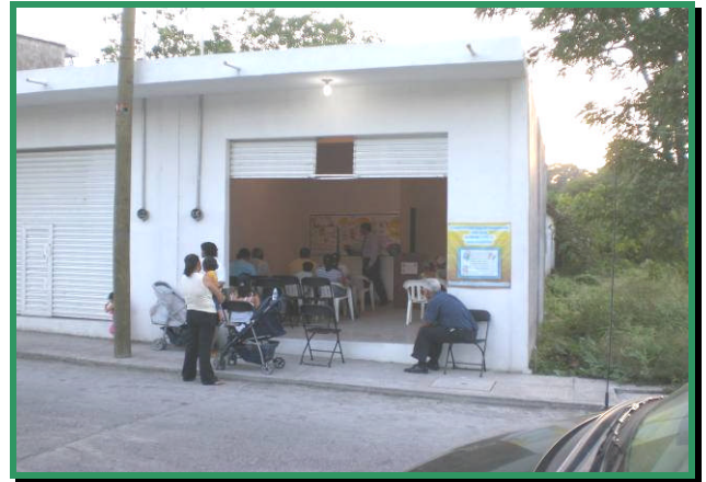
Local rentado en Cotaxtla, Veracruz