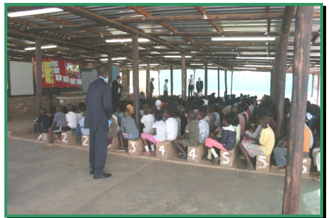
500 niños en una Escuela Bíblica en Botswana, Africa. Gracias a la familia Renzi, de Barrington, USA. ■