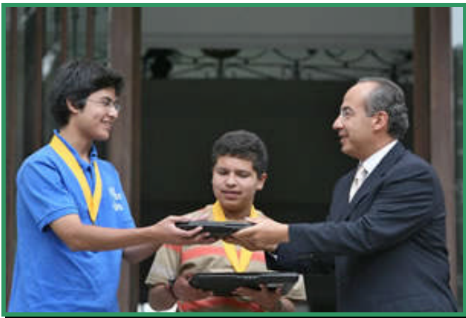
El Presidente de la República, Felipe Calderón Hinojosa, entregó un reconocimiento a nuestros expertos en Geografía.

La competencia examina a adolescentes en geografía, demografía e historia política. Se le pidió a los equipos y a sus integrantes por separado que identificaran errores en mapas, así como países con base en estadísticas demográficas y el origen de instrumentos musicales tribales y reliquias talladas que fueron prestadas por el Museo del Hombre, con sede en San Diego.