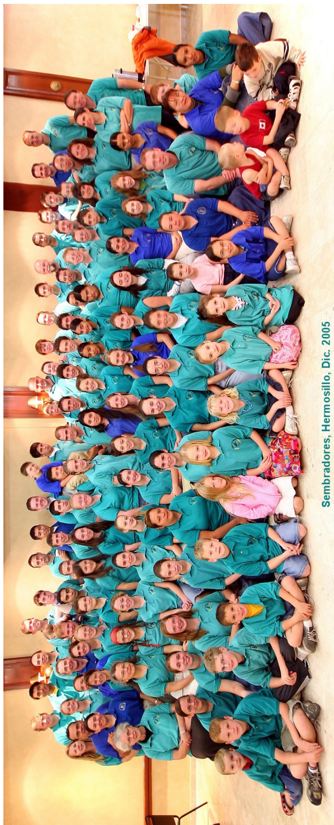
Sembradores, Hermosillo, Dic. 2005