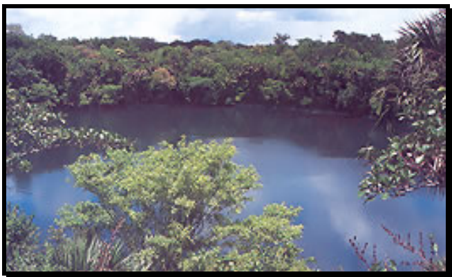
El Cenote Zacatón, en Tamaulipas, México

El 6 de abril de 1994, Sheck Exley, el mejor buceador mundial de cuevas (impuso dos marcas de profundidad: 238 metros en 1988 y 265 metros en 1989) se sumergió en las aguas del Cenote Zacatón , junto con su compañero Jim Bowden, para intentar romper por vez primera la marca de los 1,000 pies (305 metros) de profundidad. Cenote es una palabra de origen Maya (tz'onot) que significa pozo , o abismo , y es el nombre que se le da a depósitos profundos de agua manantial que se encuentran especialmente en Yucatán y Tamaulipas. La poza del Zacatón, la cavidad inundada más profunda descubierta hasta la fecha, es el "abismo sin fondo" que todos los buzos de cavernas ambicionan explorar. Esto fue lo que despertó la pasión de Sheck Exley pero desafortunadamente, le sobrevino algún problema y se ahogó a los 276 metros . Lamentablemente, el mejor buceador de cuevas del mundo murió en el abismo más profundo del planeta.