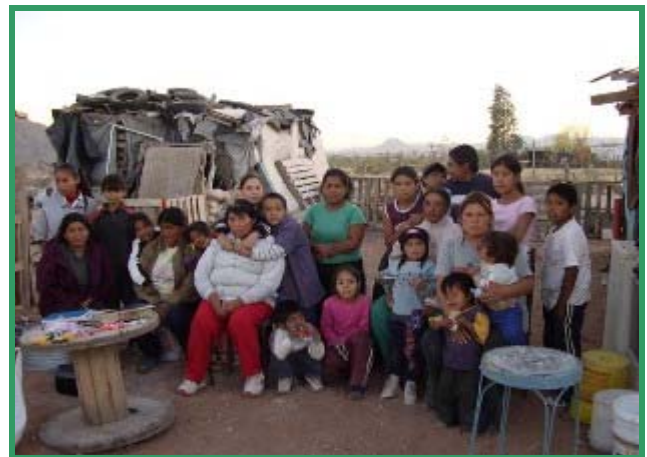
Mucha necesidad en la colonia "Nuevo México, Chihuahua.