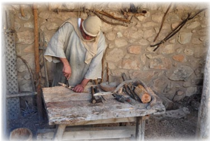
Un carpintero de Nazaret