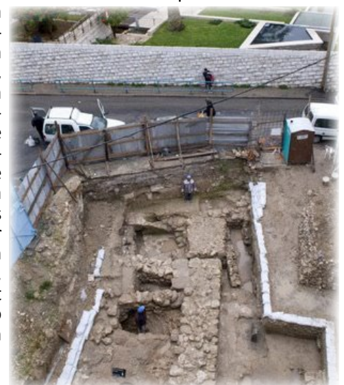
La excavación de la casa en Nazaret que data del siglo I